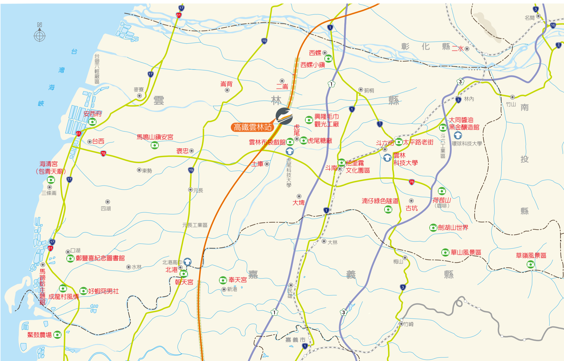
●本地圖非依比例尺繪製