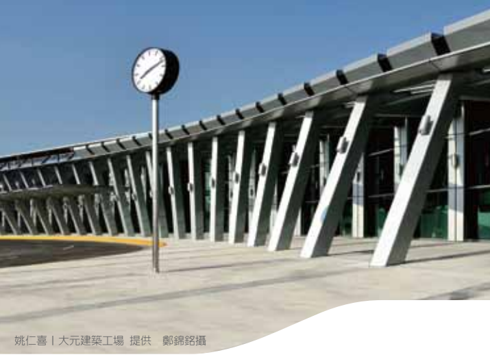
雲林站 Yunlin Station