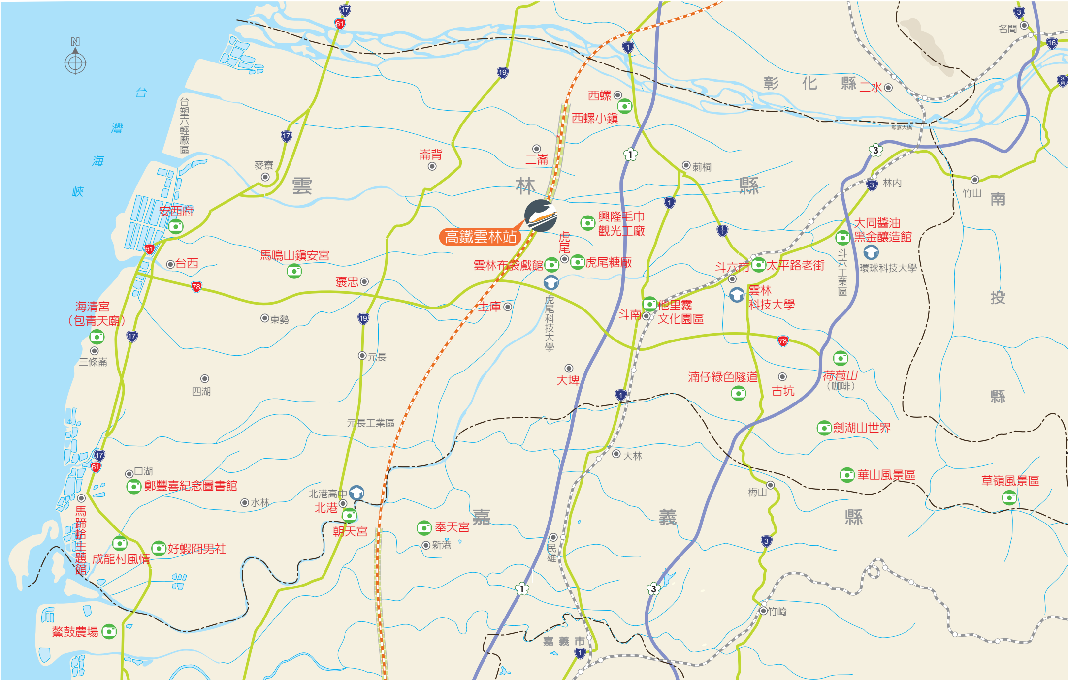
● 本地圖非依比例尺繪製