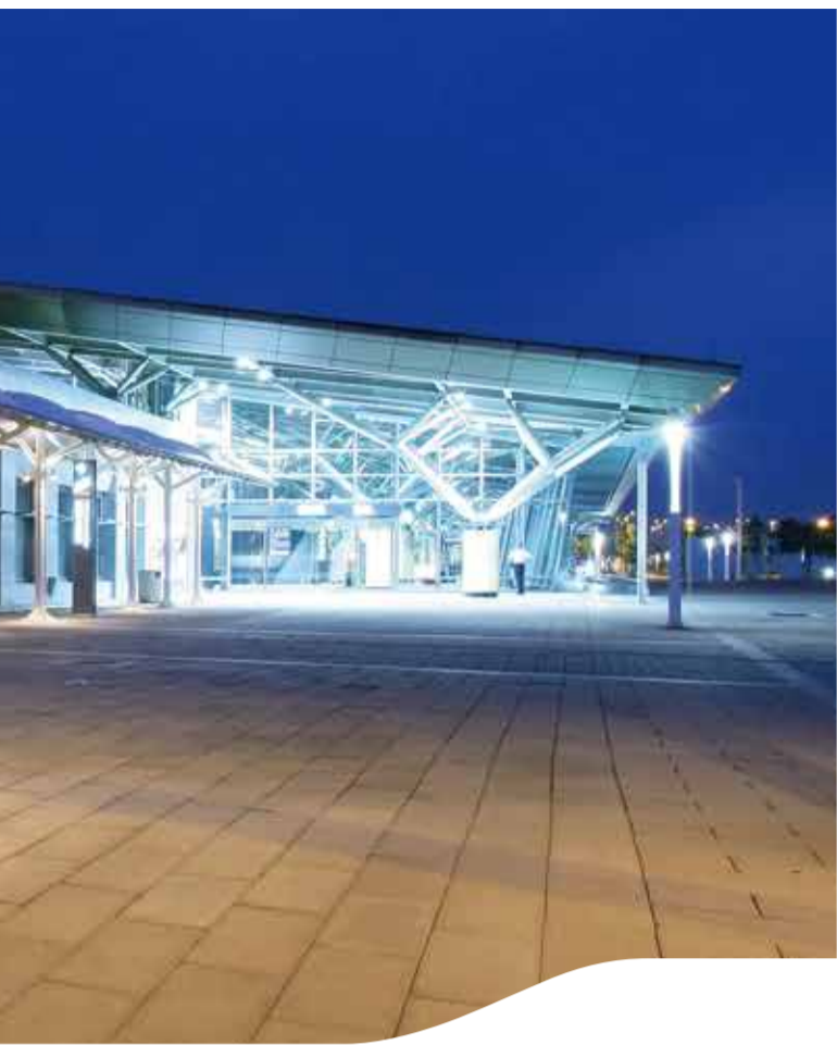
台南站 Tainan Station