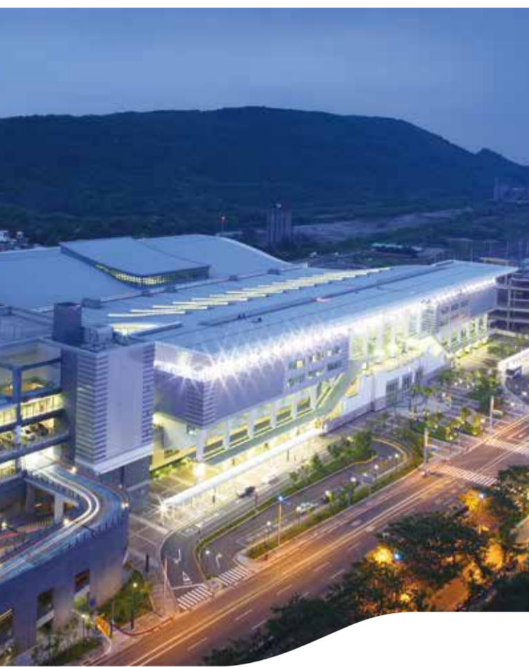
左營站 Zuoying Station